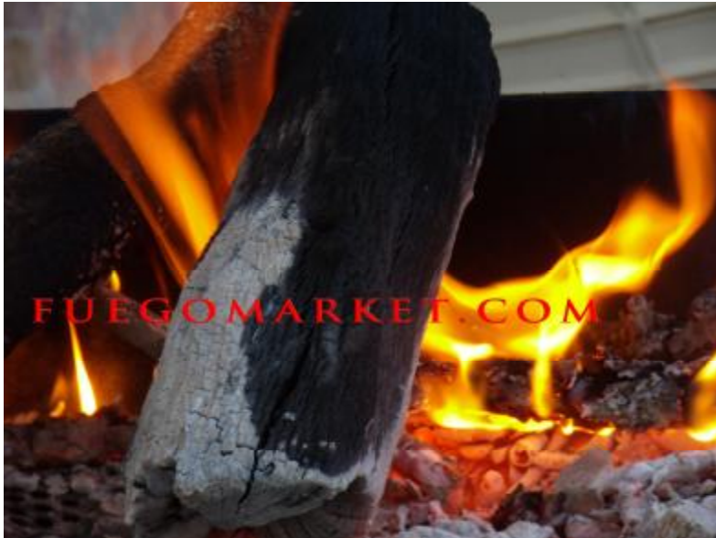
Su carbón vegetal de tamaño y duración extra para barbacoas.