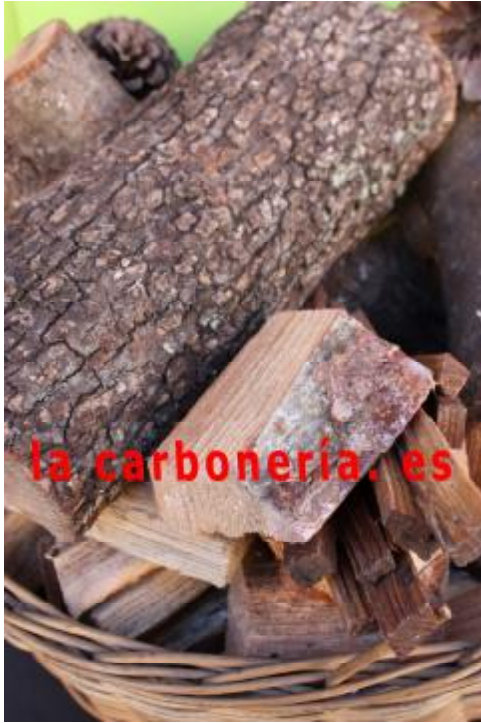
BODEGON DE LEÑA DE ENCINA Y UNAS ASTILLAS DE PINO