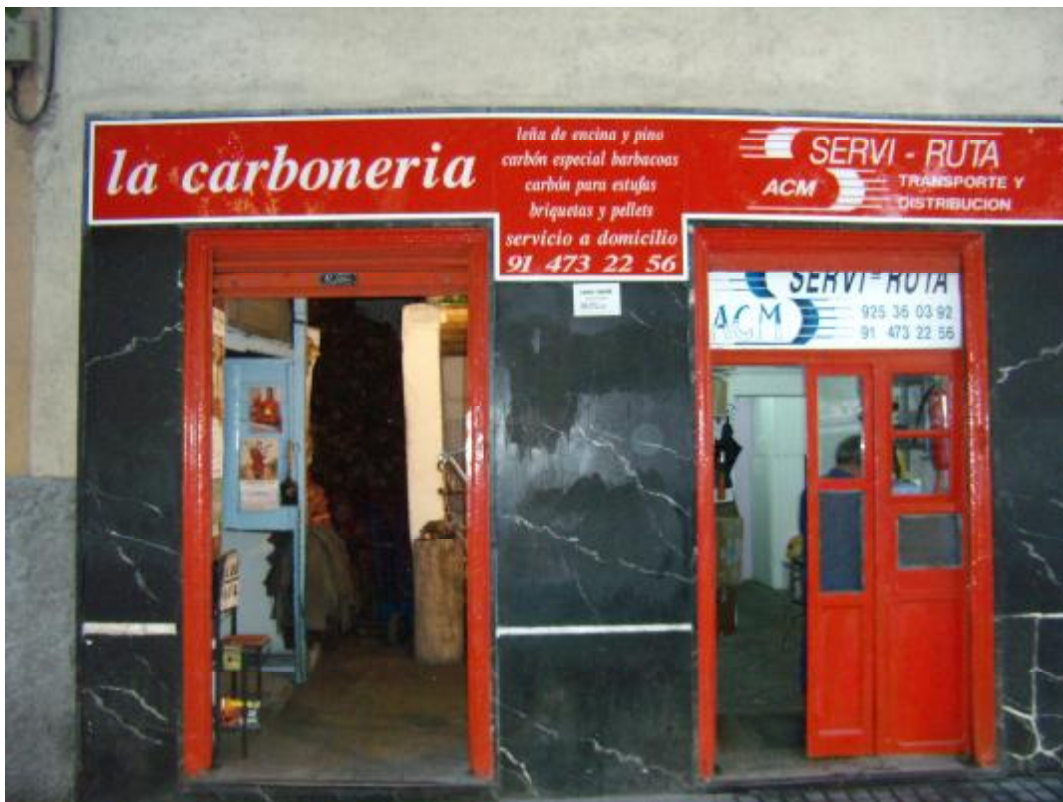
IMAGEN DE 2004 DE LA CARBONERIA

Os mostramos algunas imágenes tanto de la tienda como de sus productos.